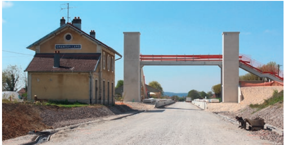
Baustelle am Bahnhof Grandvillars.

Die 1871 unter Mithilfe der EST gegründete Berner Jurabahn (JB) hatte das Ziel, die Strecke Porrentruy – Delémont – Basel schnellstmöglich zu bauen. Eine Zweigstrecke sollte Delémont mit Biel verbinden. Die JB übernahm bald auch die PD und die Gesamtstrecke von Delle bis Basel wurde am 30. März 1877 eröffnet, die Zweigstrecke nach Biel am 24. Mai 1877. Insgesamt wurden 32 Millionen Franken investiert, davon 18,5 Mio. vom Kanton Bern, 7,4 Mio. von den jurassischen Gemeinden, 4 Mio. von der EST, 1,4